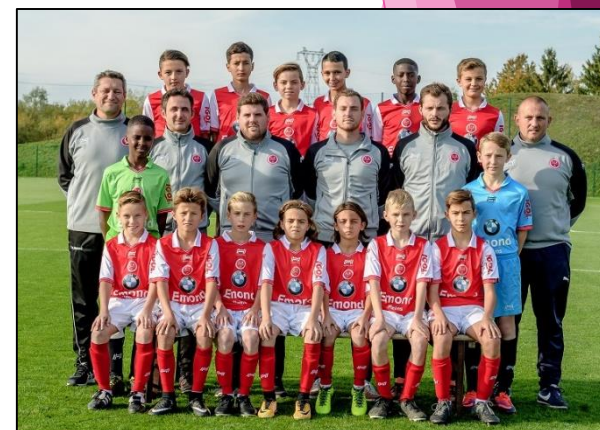
Groupe 6 ème