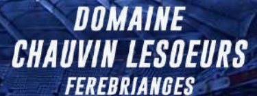
Coupe Séniors Chauvin-Lesoeurs